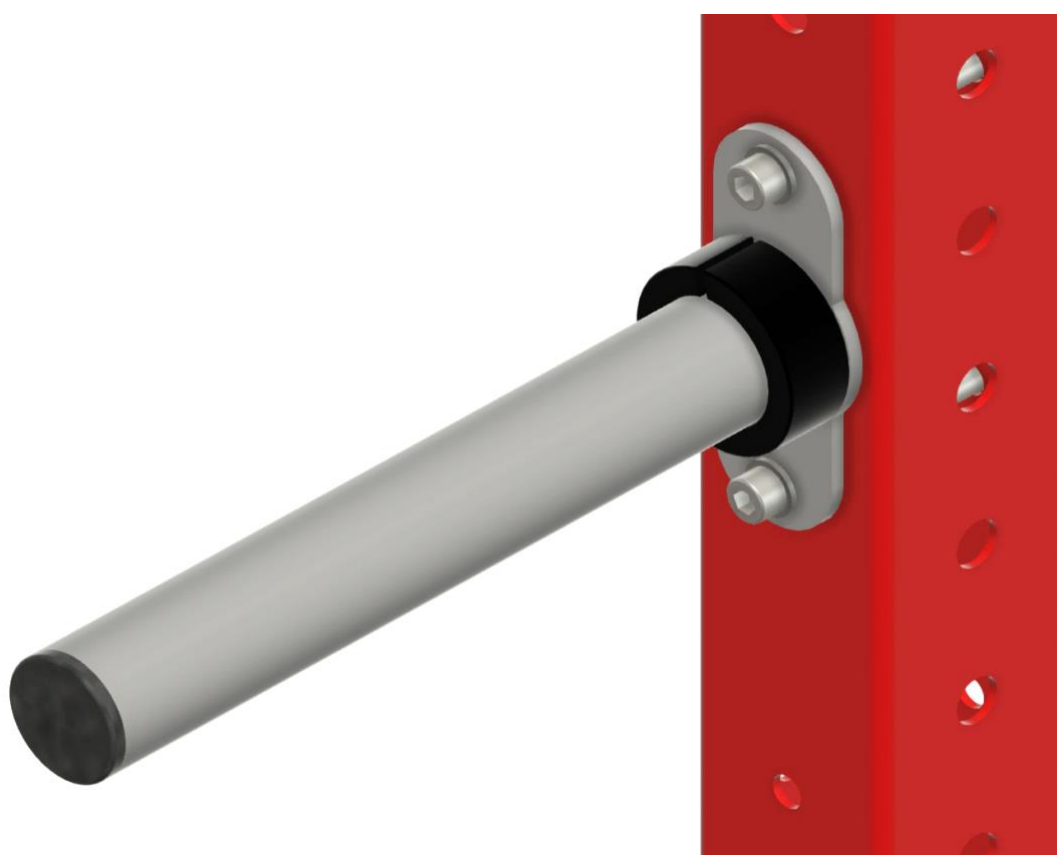
PLATE HOLDER HORIZONTAL